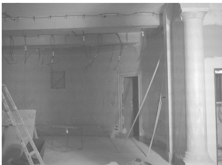
Chantier en cours: la chapelle

2002/2003. Le nouvel OGEC prendra le doux nom d'organisme de gestion de l'enseignement catholique de Notre Dame de Sion - Saint Jean-Saint Paul - Sainte Mathilde (Sainte Mathilde devant être associée de par la volonté des familles donatrices des terrains sur lesquels nos établissements sont construits). Son existence légale prendra effet rétrospectivement au premier septembre 2003.